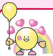
名古屋福祉専門学校 イメージキャラクター にじマル