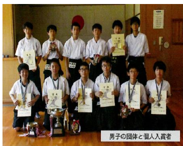
男子の団体と個人入賞者