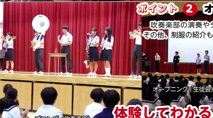
オープニング (吹奏楽部)