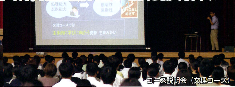
コース説明会 (文理コース)

各コースの特徴をプレゼンテーションします。実際にそのコースで学ぶ生徒も登場し、生の声を聞くことができます!