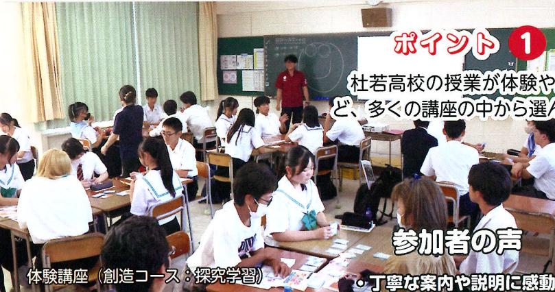
体験講座 (創造コース:探究学習)