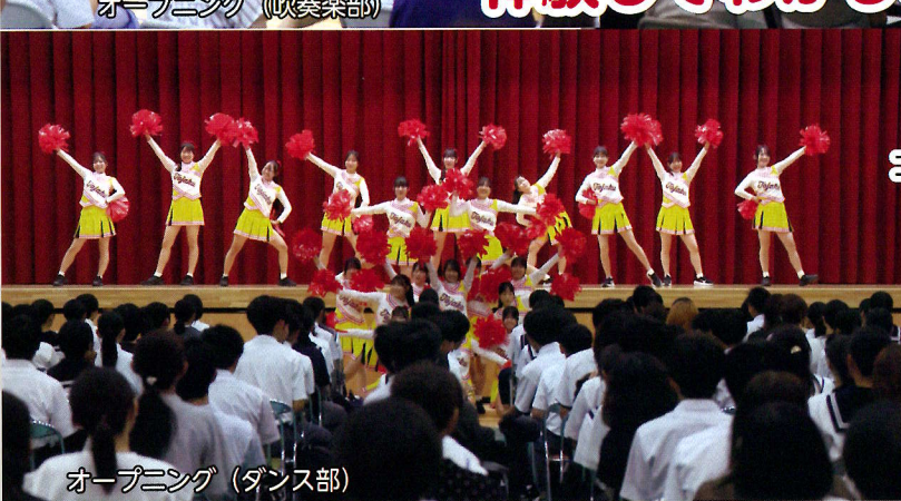
オープニング (ダンス部)